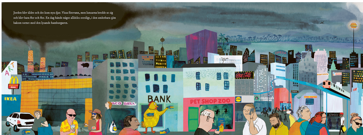
Bild 1. Människorna brer ut sig. Ur Mitt bottenliv . Av en ensam axolotl! (2020) av Linda Bondestam. © Linda Bondestam.

Beauvais påpekar som tidigare nämnts att läsarens tolkningsfrihet begränsas av ikonotexten, som styr läsaren i riktning mot vissa tolkningar ( The Mighty Child 79). Luckornas styrning bildar de didaktiska luckornas konturer. Ett exempel på hur luckornas konturer styr återfinns på uppslag 9 (se bild 2). Orsaken till den stora flodvågen och branden som föregår den skildras inte direkt, men det skräp som samlas på sjöbotten, och det axolotlen ser när den simmar upp till ytan ger ledtrådar om bakomliggande orsaker (jfr Österlund, "Evolutionen är vi"). Ovanför ytan är allt nedsläckt. De djur som visas på uppslaget är sådana som människan fångar in eller håller fångade för föda: fiskar i nät och kor utanför en fabrik. Människorna som gör detta är däremot ansiktslösa, de befinner sig inne i fordon eller byggnader. Dessa detaljer utgör tillsammans luckornas konturer, det som styr läsaren mot en tolkning: att det är människans exploatering av naturen som orsakar den brand och den flodvåg som följer två uppslag senare.