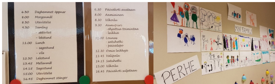
KUVA 1. Tekstejä kahdella kielellä kielirikasteista (suomi–ruotsi) varhaiskasvatusta toteuttavan ryhmän fyysisissä oppimisympäristöissä.

Fyysiseen ympäristöön voidaan tuki lisätä myös kuvia, tekstejä tai kirjoja, joilla stimuloidaan kaksikielisen opetuksen kohdekielen käyttöä (ks. myös From ym. tässä teemanumerossa).