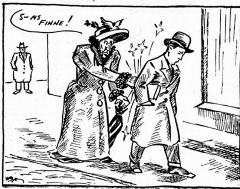
Kuva 5. ”Vaalitaisteluun” Ajan Suunta 7.11.1935.

osallistuivat ruotsalaiset eilen tavaksi tullein katurähinöin. Sankarikuninkaan muisto kiihdytti niin vanhoja tätejäkin, että sanat eivät riittäneet, vaan piti siirtyä ”suoran toiminnan linjoille”. Milloinkahan suomenkielisille puolueille selviää, että suomalaisuuden aate on liian ylevä vietäväksi katurähinään?