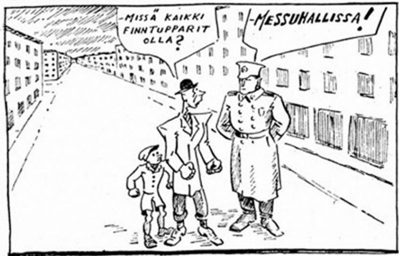
Kuva 6. Ajan Suunta 6.11.1936.

Tänä päivänä on sotahuutomme: »Messuhalli täyteen!» Kansallinen herätys on Helsingissäkin saatava täydessä voimassaan käyntiin, niin että maan pääkaupunki aivan lähimmässä tulevaisuudessa voisi olla sekä kielen että mielen puolesta täysin suomalainen. Epäkansallinen mieli, jonka räikeimmät ilmennykset ovat »itäruotsalaisuus» ja marxilaisuus, on hävitettävä. Taistelu käy kiiuvaana. Kansallisen herätyksen puolesta taistelevat kokoontuvat tänään yhteiseen juhlaan saamaan innostusta ja herättäviä ajatuksia. Messuhalli täyteen!