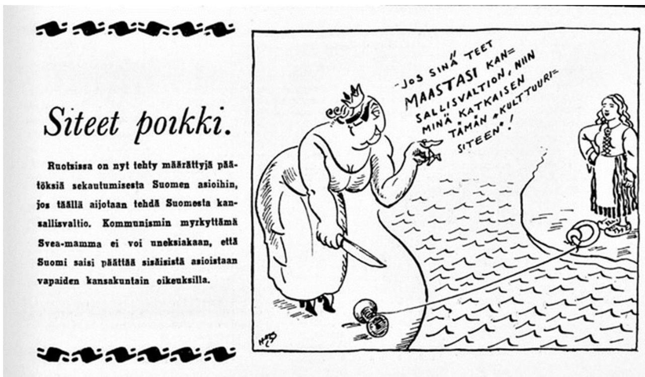
Kuva 2. "Siteet poikki" Ajan Suunta 17.11.1933.

vaalimenestys perustui osaltaan kokoomuksen kanssa tehtyyn onnistuneeseen vaaliliittoon, minkä seurauksena kokoomuksen paikkaluku väheni 42:sta 18:aan. Vaalien selkeä voittaja oli kuitenkin SDP, joka sai 12 lisäpaikkaa. Eduskuntavaalien tulos – maltillista politiikkaa harjoittaneen SDP:n paikkaluku kasvoi 78 edustajaan – osoitti, että suomalainen demokratia oli selviytynyt oikeistoradikalismin aiheuttamasta kriisistä. Vaalituloksesta huolimatta oli selvää, että niin kotimaan poliittiset muikutukset kuin eurooppalaiset esimerkit olivat tuoneet lainvastaisen väkivallan käytön yhdeksi keinoksi ajaa omia poliittisia päämääriä. Tästä yhtenä konkreettisena ilmenemismuotona nousi esille Helsingissä vuonna 1933 tapahtuneet ruotsalaisuuden päivän mellakat. 29