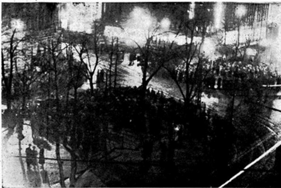
Tuokiokuva iltayöstä Heikinpuistosta.

Marraskuun 6. päivän iltana mellakat olivat kuitenkin todellisuutta. Helsingin keskustassa liikkeli tuhatmäärin ihmisiä, jotka eri tavoin osoittivat mieltään joko suomalaisuuden tai ruotsalaisuuden puolesta. Tämä tarkoitti huutamista, laulamista ja myös väkivaltaisuuksia. Samoin kuin edellisellä vuonna kaupungilla myytiin takinrinnoissa kannettavia messinkisiä suomalaisuuden ja punakeltaisia ruotsalaisuuden merkkejä.