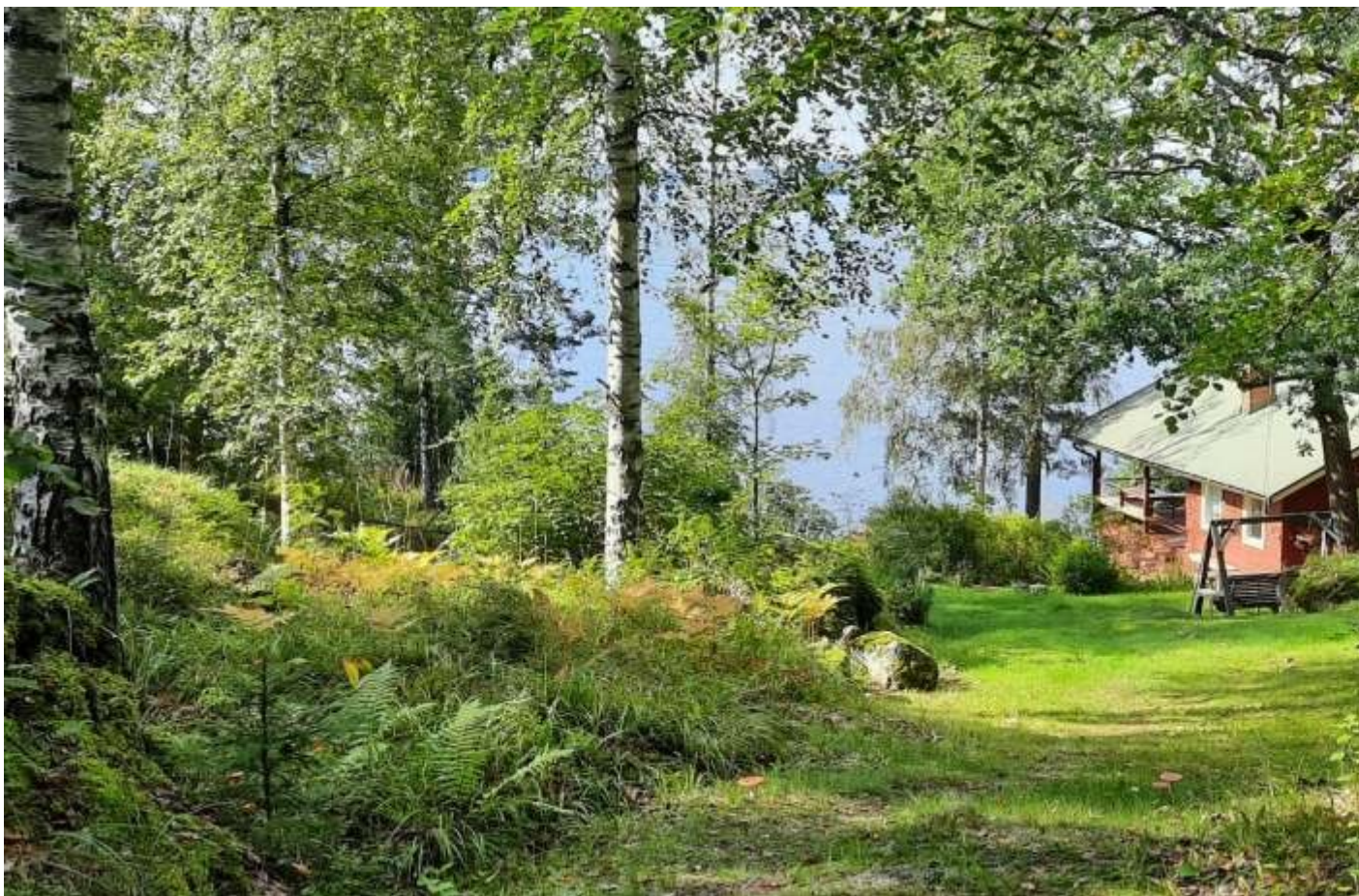
Äldre sommarstugor kräver relativt mycket underhåll för att inte förfalla.

Materialet som vi kommer att analysera i artikeln är svaren på frågelistan ”Sommarstugeliv – användning, samägande, arv”. Frågelistan utvecklades av oss i samarbete med Kulturvetenskapliga arkivet Cultura vid Åbo Akademi, och i den efterfrågades upplevelser av samvaro och ägande av sommarstugor, på gott och ont. Frågelistan skickades till arkivets fasta sagesmannanät men den fanns också tillgänglig på nätet för vem som helst att besvara. Frågelistan var öppen mellan mars och september 2021 och resulterade i 59 svar; 41 på svenska och 18 på finska. I denna artikel använder vi oss enbart av de svenskspråkiga svaren. De som svarade på frågelistan var både äldre personer som inte alltid haft ekonomiska förutsättningar att ha en sommarstuga, och medelålders personer som har sommarstuga som används av flera generationer. Svararna är främst födda på 1950–70-talen och bor i olika delar av Svenskfinland. Allt från enkla stugor till fullt utrustade fritidshus återfinns i materialet. Materialet har en viss slagsida åt äldre, enklare sommarstugor framom nybyggda, mer välutrustade fritidshus. Materialet är relativt litet men svaren är ingående och fungerar väl för att ge svar på de frågor som intresserar oss.