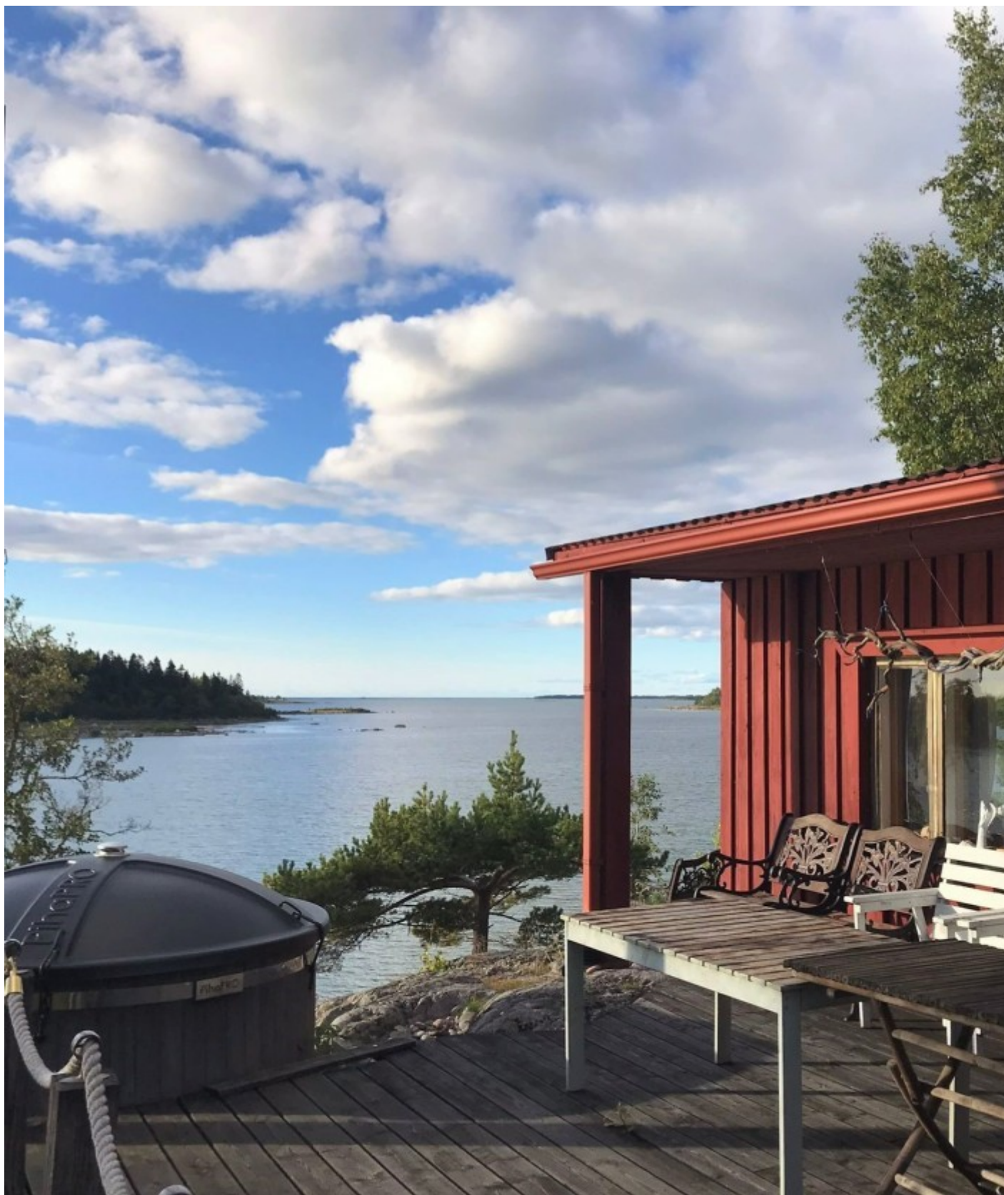
Sommarstugeliv innebär också att kunna njuta av utsikt över hav eller sjö.

också innebära ett ansvar och en prioritering av tidsanvändning som ett vuxet barn varken behöver eller önskar ha.