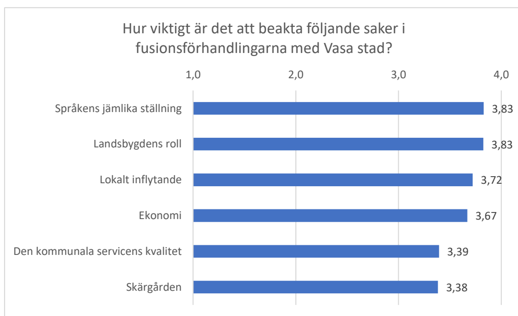
Figur 1. Medeltal enligt temaområde på fråga 1.

I fråga 1 i enkäten fick deltagarna ta ställning till 21 påståenden ordnade enligt sex temaområden som t.ex. lokalt inflytande, landsbygdens roll och språkens ställning. Frågan lydde "Hur viktigt är det att beakta följande saker i fusionsförhandlingarna med Vasa stad?". Svartalternativen var 1. "inte alls viktigt", 2. "ganska oviktigt", 3. "ganska viktigt", 4. "mycket viktigt" och 5. "tar ej ställning". De svar som angett "tar ej ställning" ingår inte i figurerna. Siffrorna är baserade på 205 enkätsvar i samband med delaktighetsforumen i Solf, Kvevlax och Toby.