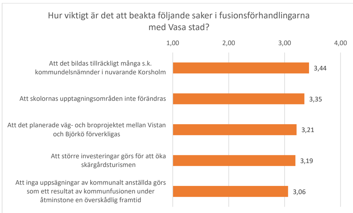
Figur 3. De fem påståenden som fick lägst medeltal i svaren på fråga 1.

De fem påståenden som fick lägst medeltal av de sammanlagt 21 påståendena presenteras i Figur 3 nedan. Medeltalet är fortfarande högt (3,06–3,44) för dessa påståenden, vilket innebär att de ändå anses som viktiga att beakta i förhandlingarna. Men i en jämförelse med påståendena i Figur 2 ansåg deltagarna att dessa är mindre viktiga. Det påstående som prioriterades lägst gällde uppsägningar av kommunalt anställda.