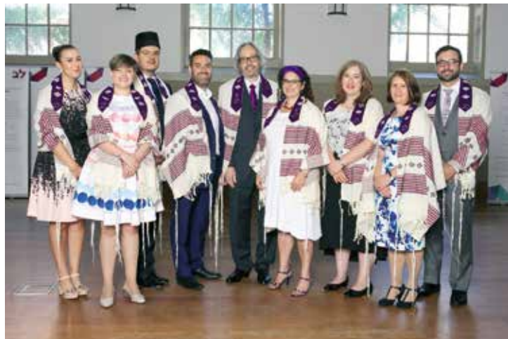
Leo Baeck Collegessa voi opiskella rabbiksi.

Kyseessä ei ole mikään yksinkertainen anti-intellektuelli retroliike, jossa ihannoidaan muinaisaikojen legendaarista ja ”aitoa” juutalaisuutta. Enemminkin he etsivät laajempaa ja monimuotoisempaa tapaa ymmärtää ja elää progressiivista juutalaisuutta. Haastateltavat toivovat löytävänsä jotakin syvempää ja väljempää kuin sen, mitä perinteinen kahtiajako ortodokseihin ja liberaaleihin sallii. Saavuttaakseen tämän he yhdistävät hyvinkin liberaalin teologisen näkemyksen perinteisemmän uskonnonharjoituksen kanssa – uusissa, innovatiivisissa ja joidenkin mielestä provosoivissakin yhdistelmissä. Se, että he haluavat muokata uskonnonharjoitustaan perinteisemmän kaavan mukaan, ei ole ristiriidassa heidän liberaalien, tasa-arvoisten uskonnollisten