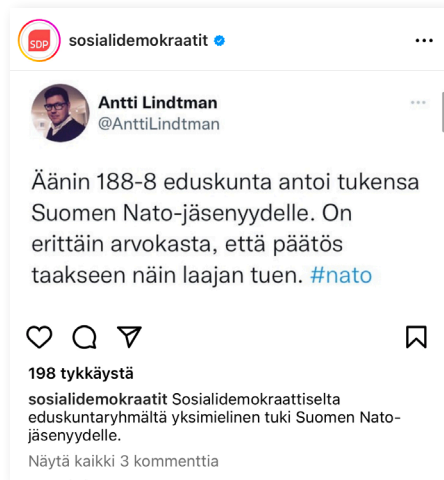
Kuva 10. Tilin @socialidemokraatit Instagram-julkaisu 17.5.2022, jossa ilmoitetaan eduskunnan päätöksestä hyväksyä Suomen Nato-jäsenyys.

painottua kysymys Suomen turvallisuudesta (KOK, 27.4.2022, 30.4.2022, 11.5.2022; PO 19.3.2022; SDP 13.4.2022, 1.5.2022, 14.5.2022, 16.5.2022; SM 2.4.2022, 1.5.2022) ja rauhasta (KOK 1.4.2022, 4.4.2022, 8.4.2022, 12.4.2022, 25.4.2022, 27.4.2022, 16.5.2022). SDP julkaisee 14. toukokuuta kuvan Marinista ja kannanotosta: ”Tehtävämme on kaikissa tilanteissa turvata Suomen itsenäisyys, koskemattomuus ja suomalaisten mahdollisuus elää elämänsä turvallisesti ja rauhassa” (kuva 7).