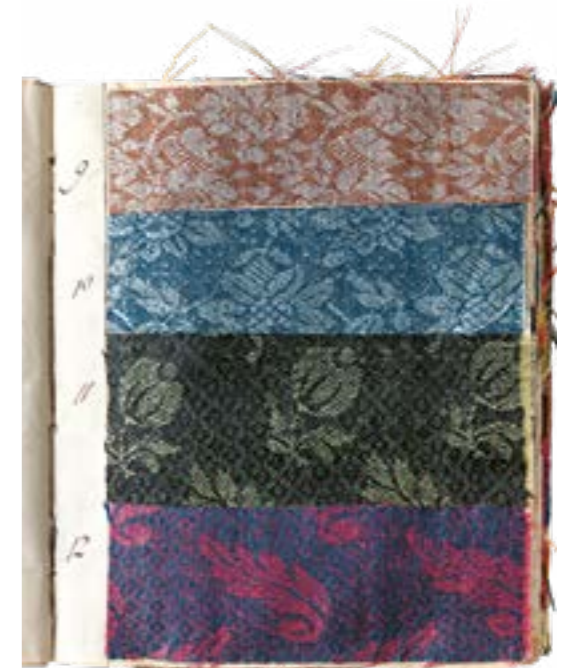
Rokokotyger var färggranna och rikt mönstrade med blommor eller girlander. Bilden visar textilprover ur professor Anders Berchs läromedel Theatrum oeconomico-mechanicum från ca 1731, som bland annat förevisade svensktillverkade tyger för studenter vid Uppsala universitet.