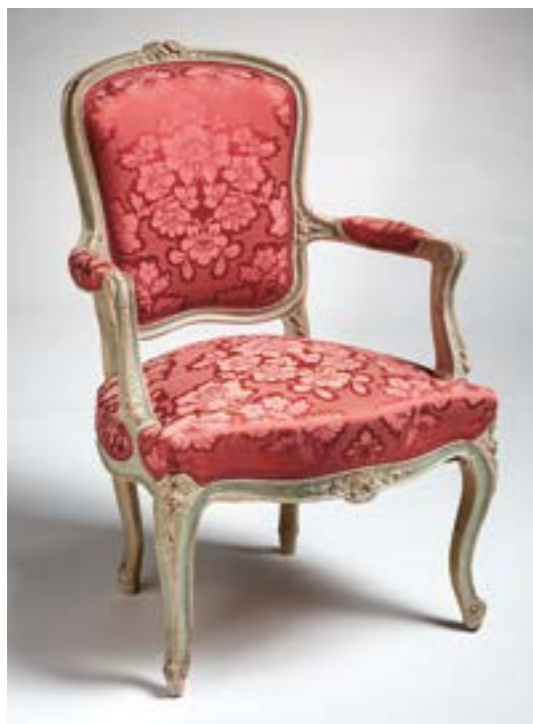
Sittmöblerna under 1700-talet blev mer bekväma än tidigare utan att förlora i ståndsmässigt utförande. Denna fransktillverkade fåtölj har stoppade armstöd, sits och ryggstöd klädda i ett elegant sidentyg och möjliggjorde en avslappnad hållning i salongerna. Finlands Nationalmuseum, Helsingfors.