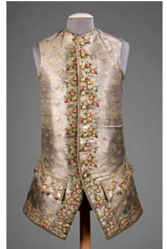
Rikt broderade västar med blomsterornament var en väsentlig del av mäns tredelade kostym under hela 1700-talet. Denna väst av sidentyg, broderad med silkes- och metalltråd och bakstycke i linne är sannolikt av brittiskt ursprung från mitten av 1700-talet. The Metropolitan Museum of Art, New York.