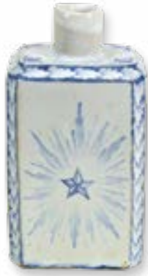
Hushållet von Fersen-Wachtmeister handlade ofta moderiktiga drycker som te och kaffe. Tedosa i fajans med en nordstjärndekoration, tillverkad av Rörstrand på 1740–1750-talet. Finlands Nationalmuseum, Helsingfors.

strömning, stockfisk och saltad lax. Även ostron, som handlades sextio eller hundra stycken på en gång, konsumerades regelbundet. Däremot köpte man sällan kött. Det finns en anteckning om färskt oxkött från mars 1749, och två andra gånger under året handlades färskt kött i juli och i augusti. En stor del av köttet som konsumerades i familjen von Fersen fraktades till Stockholm från familjens herrgårdar, vilket gör köttet osynligare än fisken i räkenskaperna. Samma sak gäller exempelvis mjöl, som köptes endast en gång under året då kocken hade akut behov för det. I övrigt försörjde gårdarna hushållet i staden med dylika varor. Även engelsk ost, holländsk ost, engelsk malt, kringlor och sockerkonfekt köptes in. Svagdricka, dubbelöl och brännvin hörde till drycker som flitigt köptes för hushållets behov. Ärtor, bönor och kryddor inhandlades från flera kryddkrämare i Stockholm. 76