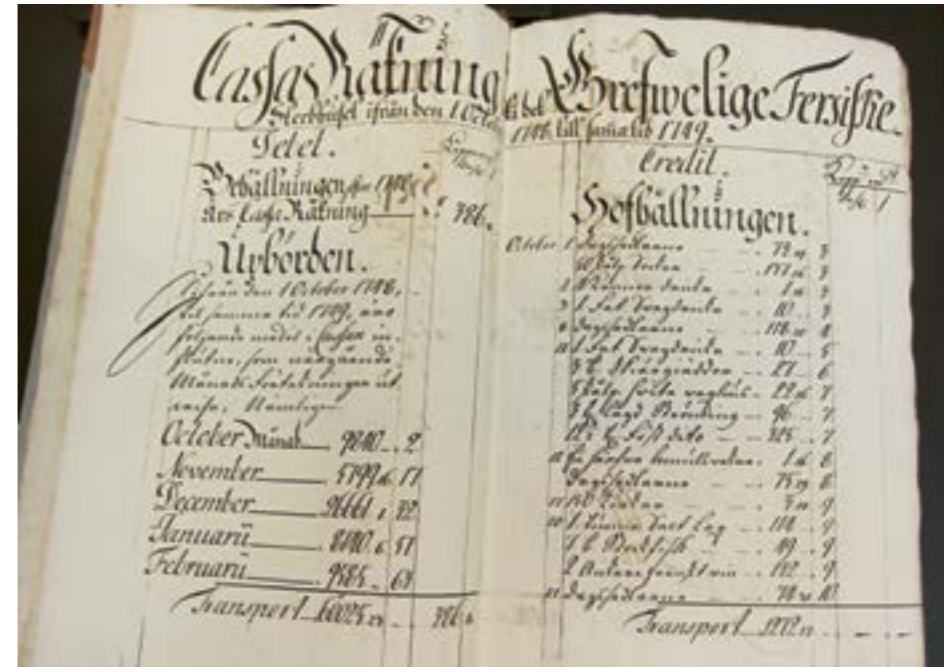
En balansräkning från det Fersenska sterbhuset från räkenskapsåret 1749 visar inkomster på vänster sida och hushållets månatliga utgifter på höger sida. Riksarkivet, Stockholm.

materialet vid behov även till andra år än 1748–1749 för att få en mer heltäckande bild av familjen von Fersens shoppingvanor.