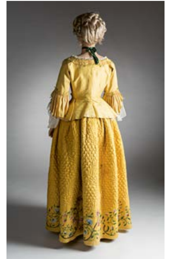
Starka färger var populära vid mitten av 1700-talet. En vaddstickad och broderad kjol var både dekorativ och varm. Denna dräkt i silke från 1765 är fodrad med linne och har använts av en högre ståndsbrud som så kallad annandagsklänning, det vill säga på festen dagen efter vigseln. Finlands Nationalmuseum, Helsingfors.