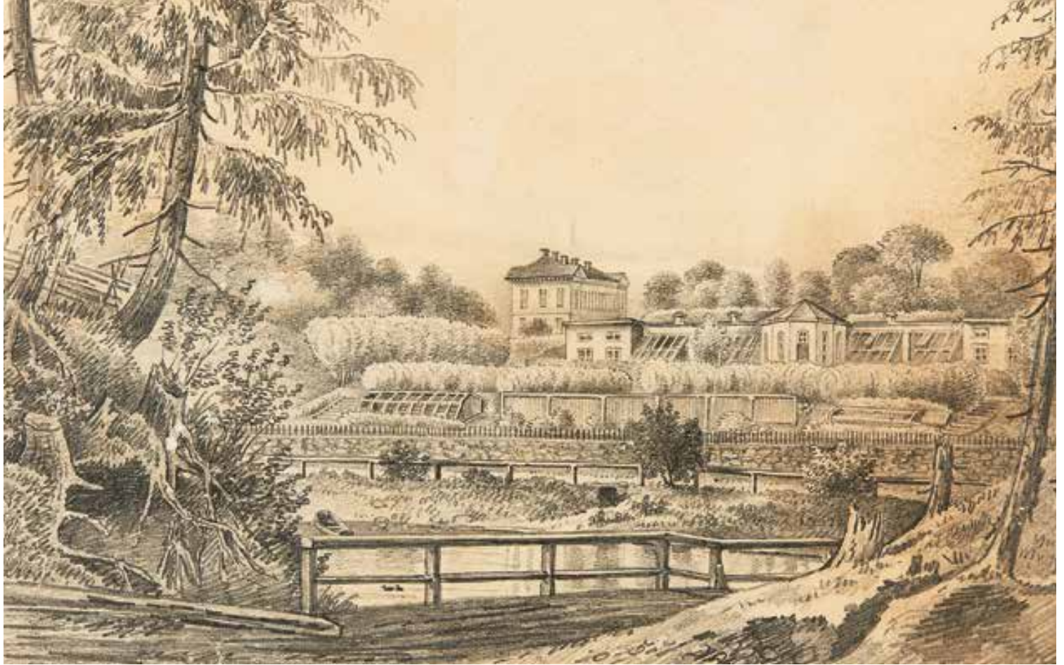
Jockis herrgård, uppförd på 1790-talet, omgiven av sin lummiga engelska trädgård med växthus från tidigt 1800-tal. Idyllen har fångats på en blyertsteckning av Magnus von Wright på 1840-talet.

sets tjänstefolk än exempelvis i Storbritannien där landskapsparkernas stora kuperade gräsmattor, träd och olika byggda terrasserings eller kullar avgränsade de olika livsmiljöerna från varandra.