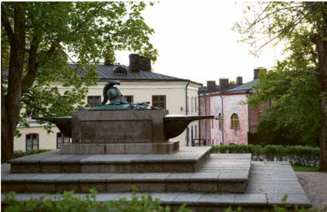
Gustav III ville att Augustin Ehrensvärds grav på Sveaborg skulle vittna om såväl Sveriges militära kapacitet som kungens och hans adliga förtrognas starka band.

Tio år efter sin död begravdes Ehrensvärd sommaren 1783 på Sveaborg i en grav planerad av Gustav III. Minnesvårdens syfte var att påminna om Ehrensvärds förtjänster i byggandet av Sveaborg och upprättandet av Sveriges skärgårdsflotta. Den skulle också påminna om Sveaborgs fästning som en betydelsefull del av det svenska rikets moderna försvar, om Gustav III:s politiska ideal och om hans långvariga personliga relation till Ehrensvärd. För kungen som hade kritiserats av aristokratin var det viktigt att synliggöra de högadliga som, i likhet med Ehrensvärd, hade stött den starka kungamakten. Hans minnesvård bör därför snarare ses som ett monument över en lojal undersåte och dennes kung än som ett gravmonument. 118 På 1700-talet utgjorde många av adelns centrala rum och verksamhetsmiljöer samtidigt slagfält för maktkampen mellan adeln och kungen. Denna symboliska kamp var särskilt påtaglig under Gustav III:s regeringstid då kungen koncentrerade alltmer av makten till sig själv och skickligt utnyttjade maktutövningens tids-typiska teatralitet. 119