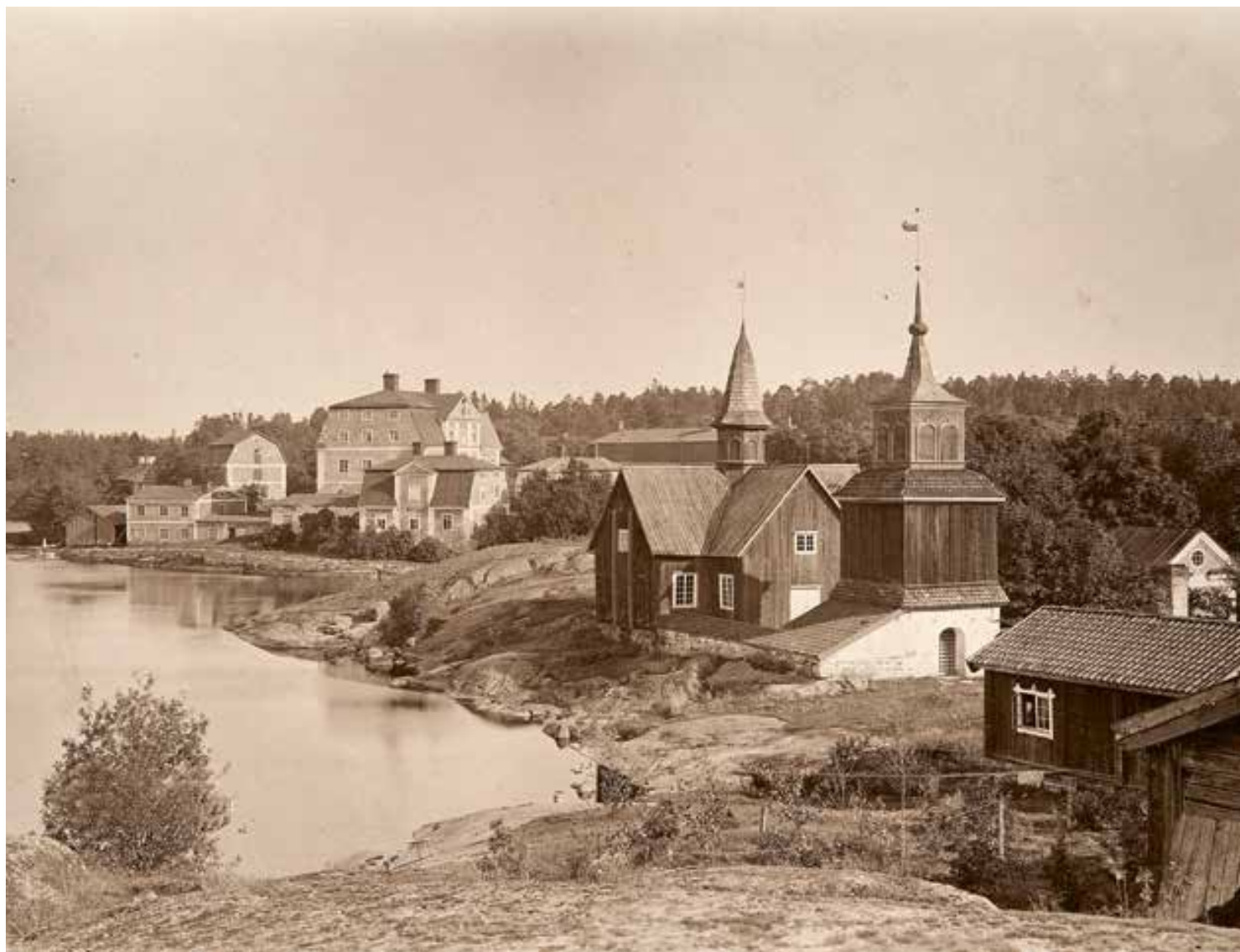
Släkten Hisingers bruksherrgård Fagervik är belägen vid stranden till Bruksträsket i västra Nyland. Karakterhuset är från slutet av 1770-talet och den lilla kyrkan från 1730-talet. I anslutning till kyrkan ligger släktens gravkapell och bakom skymtar herrgårdsparken. Fotografi från 1890-talet.