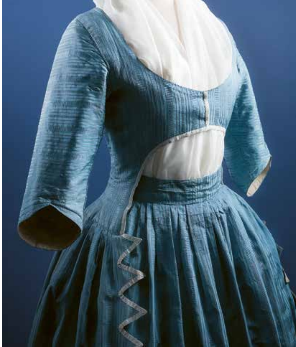
Denna tvådelade jackklänning av engelskt snitt från 1790-talet är tillverkad av blått siden och dekorerad med vita sidenband.

del kunde vara lätt stoppad. Männens klädedräkt bestod både till vardag och fest en knälång rock, en nästan lika lång väst med ärmar samt knäbyxor. 156 Peruken var en oskiljaktig del av officerens och ämbetsmannens klädsel. 157 Eftersom textilier var värdefulla återvanns ofta tygerna och gamla dräkter syddes om och moderniserades. 158 På 1700-talet växade modet snabbt och uppgifter om nya moden spreds effektivt via brev, samtal, modeteckningar, dagstidningar och från slutet av århundradet även i modetidningar. 159