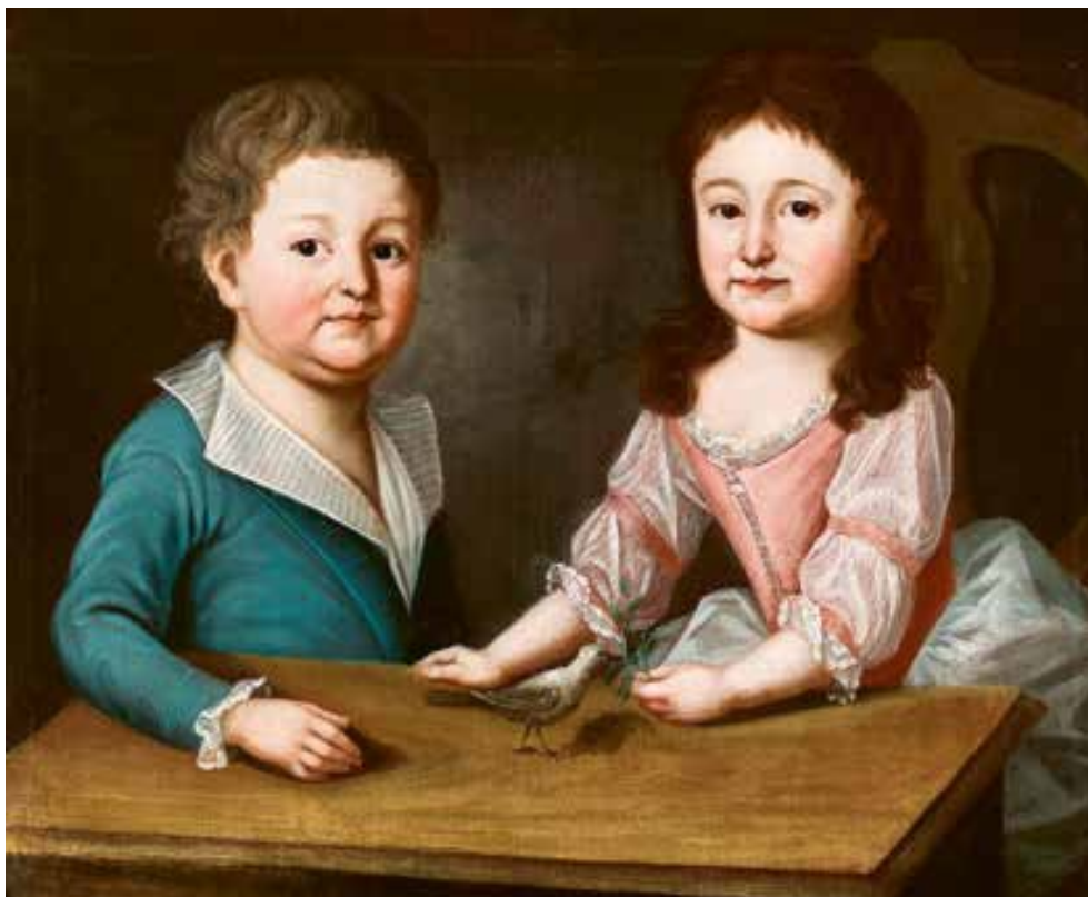
Syskonen af Forselles i slutet av 1700-talet. Adelsbarnen lekte och stöjades ganska fritt till vardags, men vandes också vid vuxet uppförande och klädsel. Målning av Nils Schillmark.