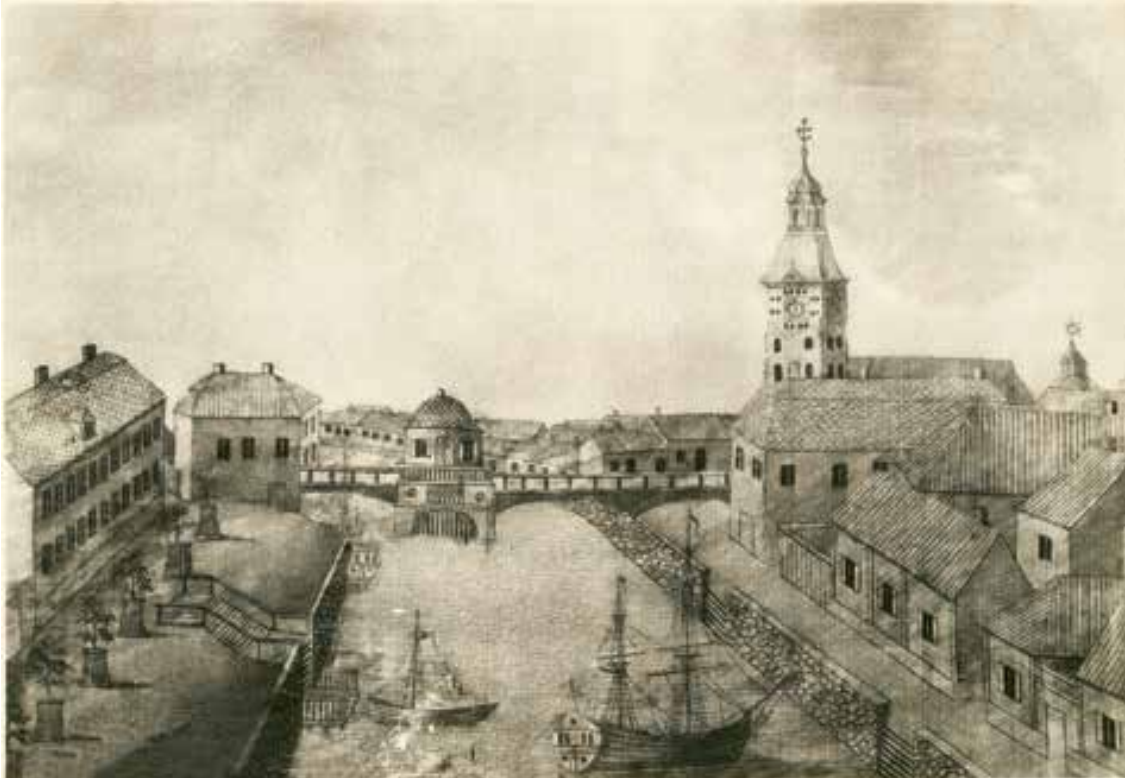
Staden Åbo på 1700-talet. Till höger domkyrkan med Kungliga Akademien och hovrätten i närheten. För ämbetsadeln var Åbo ett viktigt centrum för förvaltning och sällskapsliv.