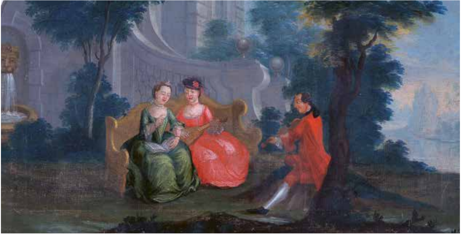
Ett musicerande sällskap avbildat 1763 på en målning på ett dörröverstycke i Hatanpää gård i Tammerfors. Musiken var en viktig del av periodens umgängeskonst.

Hon tvekade emellertid då hon dragit sig till minnes att Carl August Ehrensvärd var en radikal anhängare av upplysningens idéer och därför förhöll sig misstänksamt även till kristendomen. Sophie uppgav att hon trots allt var så pass religiös att enbart dessa omständigheter kunde komma att utgöra ett hinder för ett balanserat äktenskapligt samliv. Hon hade också hört att Carl August var skuldsatt och undrade om hans lön skulle räcka både till att betala skulderna och till att upprätthålla ett ståndsmässigt hushåll.