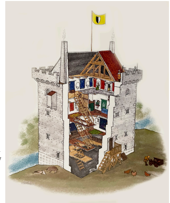
Rekonstruktion av Truid Has' bostadstorn i Örtofta, byggt omkring 1420. Illustration av Anna Jonsson. Efter Ödman 2022, s. 26.

De enskilda borgarna ägnas sedan mellan två och fyra sidor med text och bild. I brödtexten sammanfattas vad som utifrån skriftliga källor, arkeologisk evidens och författarens egna observationer på platsen kan sägas om borgen ifråga. Inte sällan saknas både skrivna källor och tillförlitliga utgrävningsrap-