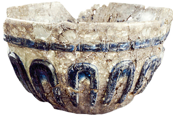
Glasskål med dekor i s.k. överfångsteknik, sannolikt tillverkad i dagens Ukraina eller Rumänien på 500-talet, funnen invid kulthusets – "temples" – eldstad.

de 40–45 hektar (att jämföra med Birkas 7 och Hedeby's 24) visste man sedan tidigare, men nu växte antalet fynd snabbt till över 35.000. Bland dem finns mynt från när och fjärran och lyxiga importvaror av glas men också lokala produkter som keramik, kammar och smycken. Den uppgift som Harrison ställer sig är helt enkelt att försöka ge den anonyma staden en position i historien, en identitet, "med hjälp av de arkeologiska fynden och med de kunskaper vi har om handel, hantverk, vardagsliv, religion och maktutövning i järnålderns Europa". Här kan konstateras att ikonografisk analys inte ingår i författarens verktygslåda.