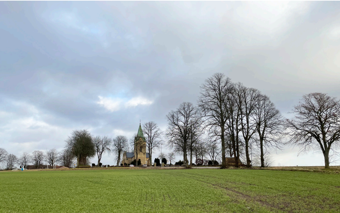
Uppåkra kyrka från väster.