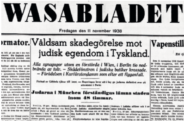
Wasabladet fördömde starkt våldet mot den judiska minoriteten under novemberpogromen. Bild: digi.kansalliskirjasto.fi.

(”Pogromer i tjugonde seklet”, Vbl 12.11.1938)