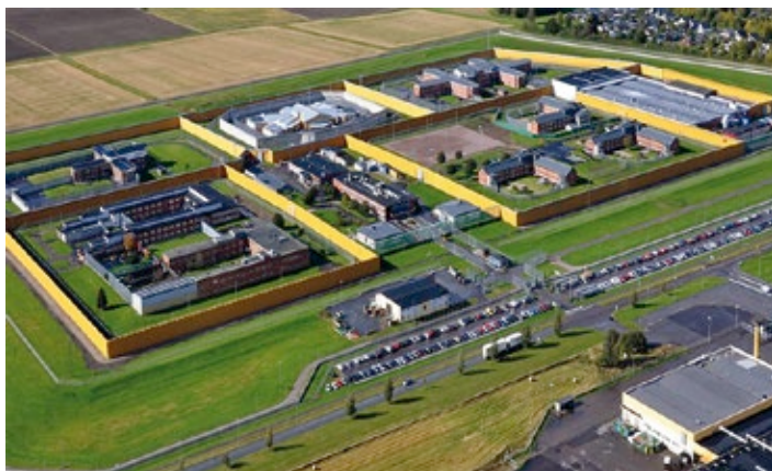
Kumlafängelsets kloster var verksamt mellan 2001 och 2018.

intagna som är intresserade av den långa reträtten har ett samtal med reträttledaren, för att se om det finns tillräckligt med motivation och allvar bakom deltagandet. En deltagare i reträtten måste ha minst fyra straffår. Kvinnliga intagna erbjuds en 10-dagars reträtt och andra former av icke-andliga reträtter (Carlsson 2010). Utöver deltagarna finns tre personer i klostret – reträttledaren, reträttledarassistenten och klostervärden. Medan assistenten och värden sköter det praktiska tar ledaren ansvar för att genomföra individuella dialoger med deltagarna under fem dagar varje vecka. Resten av tiden är deltagarna isolerade och ägnar sig främst åt att läsa Bibeln.