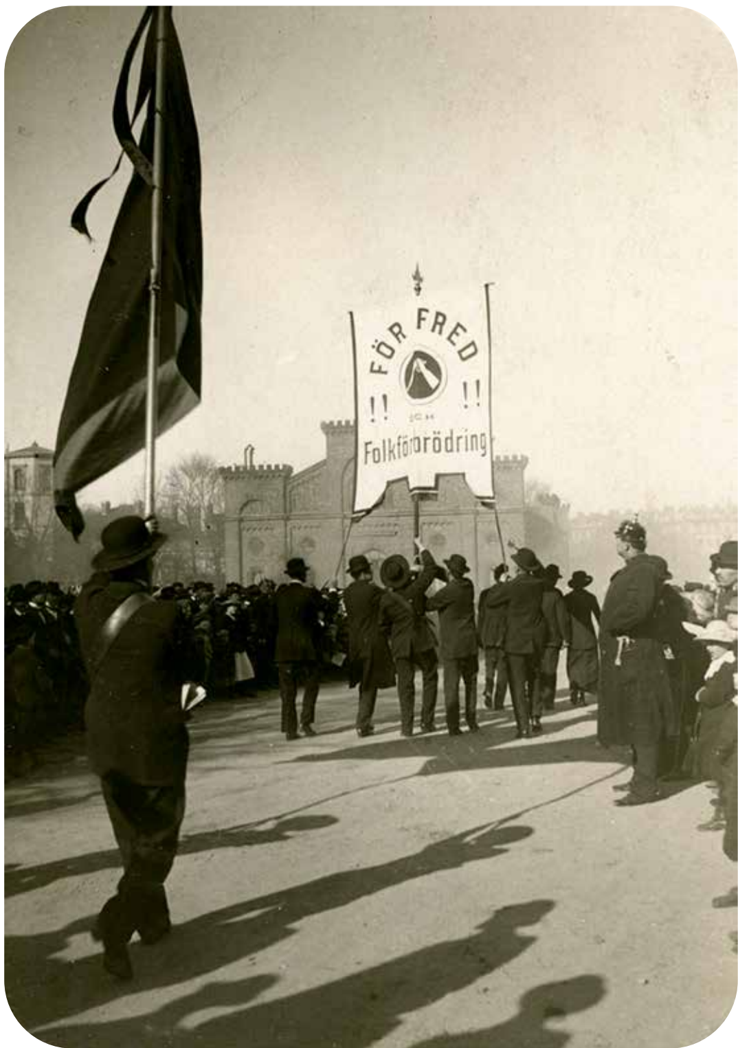
Första maj 1918 Göteborg.