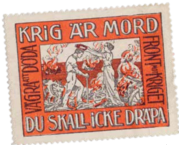
Brevmärke tidigt 1900-tal.