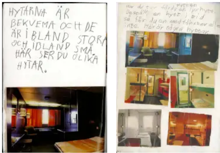
Bild: Dagens båtar presenteras utåt genom rederiernas hemsidor på nätet. Tidigare trycktes glansiga broschyrer som skulle locka resenärer. Här ett urval hyttkategorier från Silja Lines fartyg under 1980-talet, urklippa och inklistrade i ett resande barns egen version av marknadsföring. Bildcollage från 1980-talet i privat ägo.

Kryssningsfartygen rymmer både det storstilade och det mer avskalade, även om bilden utåt framför allt präglas av det förstnämnda. Numera finns inte benämningarna första och andra klass kvar, och det säljs inga däckplatser, men hytterna i kategorin "budget" saknar fortfarande egen toalett och tvingar ut de mindre bemedlade resenärerna i korridorerna när det behövs.