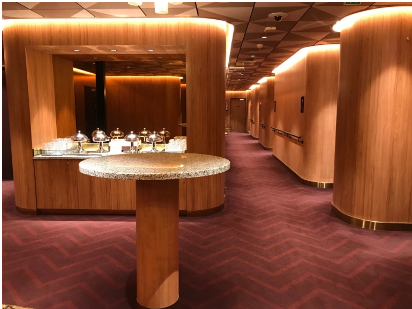
Bild: Träpanelernas återkomst i det senaste tillskottet i flottan; Viking Glory som sattes i trafik våren 2022.

Men samtidigt som delar av båten präglas av stora fönster, mjuka heltäckningsmattor och en viss lyxkänsla, finns det andra områden ombord med mer spartansk prägel. Trapporna ner till bildäck saknar dämpande mattor, korridorer och hytter på de lägre däckerna är trängre och ljudnivån högre, speciellt i närheten av maskinrummet eller vattenlinjen. Även här finns det viss kontinuitet till det förflutna. Vintertid kunde det vara riktigt svårt att somna om isen lagt sig.