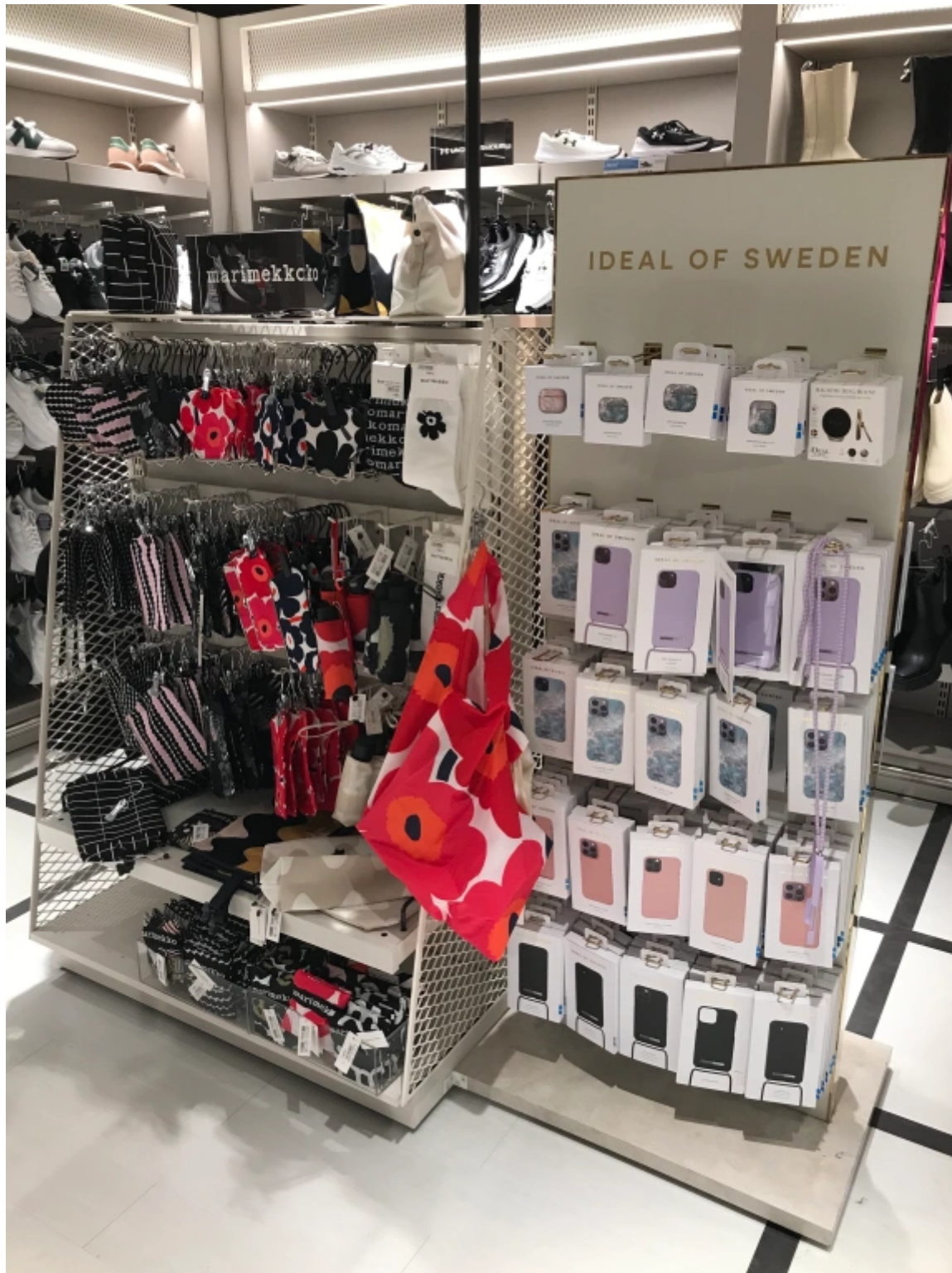
Bild: Finland och Sverige sida vid sida i taxfreen på Viking Glory.