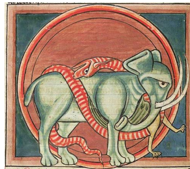
Fig. 7. Tandlös, tvåbent drake med ett vingar dödade en elefant. Bestiarium, Salisbury(?), ca 1230–1240. British Library, Harley MS 4751, f.58v.

I Aberdeen-bestiariet, skrivet och illustrerat i England ca 1200, görs tydligt vilken risk den som lämnar tron och kyrkan löper: