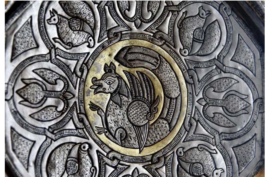
Fig. 15. Förgyllt silverfat med senmurver. Samanid-dynastin, 800–900-tal AD. Museum für Islamische Kunst, Berlin.

I norra Italien fanns sådana varor tillgängliga under hela den östgotiska, bysantinska, langobardiska och karolingiska tiden. Norr om alperna dyker de upp bl.a. i enstaka franska relikvarier så tidigt som 500–600-talen. 17 Då handlade det säkert i första hand om dyrbara gåvor från kejsaren till diverse utländska furstar, ofta som svepning av relikier. 18 Men tidigt rörde det sig säkert också om dyrbara lyxvaror som vanliga vikingar hemförde som resultat av plundringar eller fredlig handel med Bysans. Harald Hårdråde och hans 500 män som tog tjänst i den konstantinopolitanske kejsarens väringagarde 1034 utgjorde säkert en ovanligt stor nordisk kontingent, men omkring år 1000 fanns det ständigt mellan 500 och 1000 skandinaver i Bysans. 19 Att de tog med sig hem exotiska tyger eller fat med senmurver i dekoren är – givet motivets vanlighet – högst