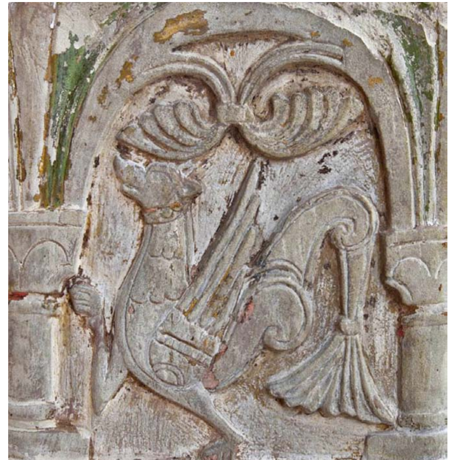
Fig. 19. Senmurv på dopfonten i Atlingbo, Gotland, tillskriven anonymmästaren Byzantios och daterad till ca 1150.

Simurgh on the baptismal font, Atlingbo, Gotland, attributed to "Byzantios", c. 1150.