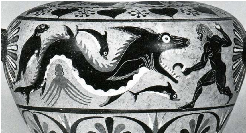
Fig. 8. Heracles i kamp med Ketos. Svartfigurig hydria, troligen gjord i Caere (nuv. Cerveteri), 500-tal BC. Stavros S. Niarchos Collection, Athens.

Heracles fighting the Cetos, Caeretan black-figure hydria, 6th century BC.