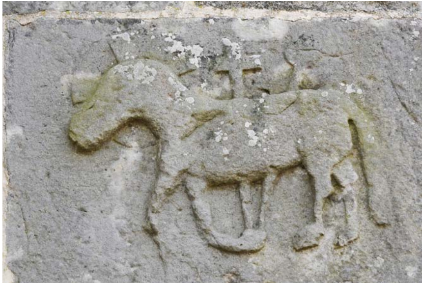
Fig. 20. Mariakyrkan i Vä. Relief med Agnus Dei på korets nordöstra hörn (se fig. 3). Foto Lars Berggren 2022.

Church of St Mary, Vä, Scania. Relief with Agnus Dei on the northeast corner of the chancel.