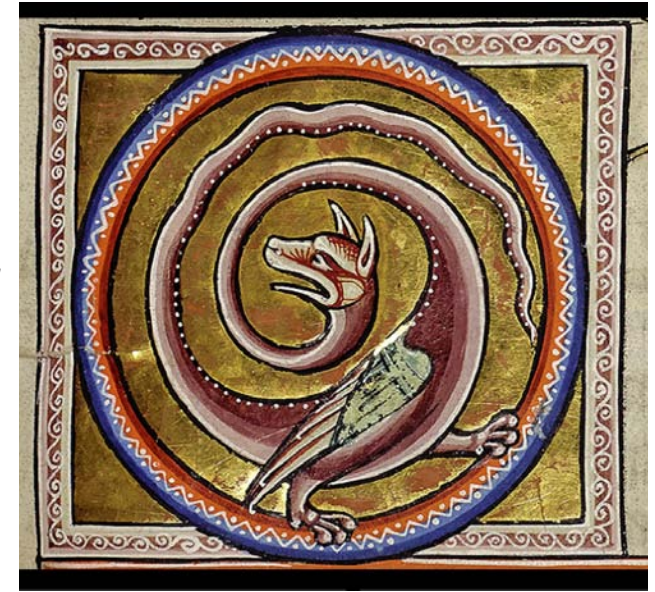
Fig. 23. Boaorm i Aberdeen Bestiary, 1100-tal, © Aberdeen University Library MS 24, f 69r.

Avslutningsvis några ord om de resterande två kvaderrelieferna. På den som Ödman träffande kallar "kanelbulle" (fig. 22) kan man i den hårt vittrade stenen ganska klart urskilja en spiralform, och med någorlunda god vilja även förstorningar i bägge ändrar som kan ha varit huvuden. De enda fabeldjur som passar in på den beskrivningen är amphisbaenan, som behandlas ovan, och boan , som oftast återges utan ben och hoprullad på ormvis (fig. 23). Den senare lever enligt Plinius och Isidorus i Italien och livnar sig på att suga mjölk ur kornas