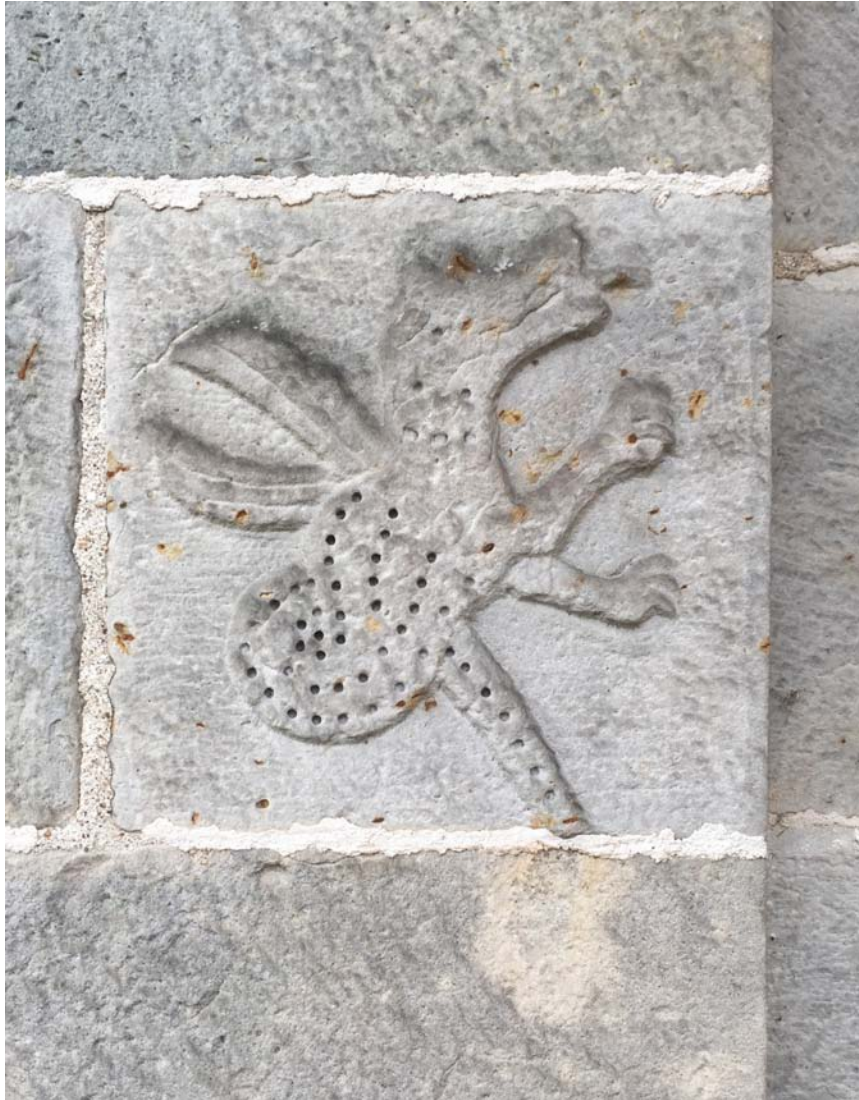
Fig. 1. Mariakyrkan i Vä. Senmurv, drake eller basilisk på pilaster på korets sydöstra hörn.

Church of St Mary, Vä, Scania. Simurgh, dragon or basilisk, relief on the southeast corner of the chancel.