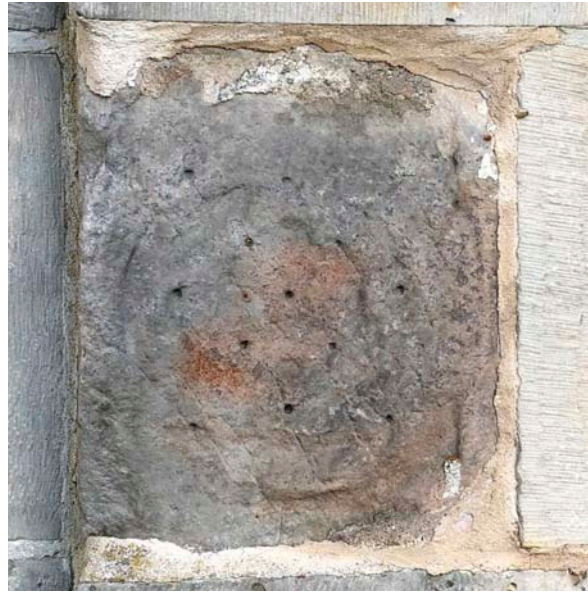
Fig. 22. Mariakyrkan i Vä. Boa (?), relief på korets sydöstra hörnpilaster (se fig. 3). Foto Anders Ödman 2020.

Church of St Mary, Vä, Scania. Boa (?), relief on the southeast corner of the chancel.