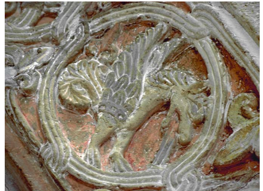
Fig. 18. Senmurv på norra transeptets baldakin i Lunds domkyrka, ca 1100. Foto Lars Berggren 2014.

På Gotland finns också ett antal dopfuntar vilkas skulpturala utsmyckningar alldeles uppenbart är gjorda efter sassanidiska förlagor, i första hand de som tillskrivs anonymmästaren Byzantios, som ska ha varit verksam där ca 1150–1185. 22 I ett av dopfuntens i Atlingbo bildfält finns ett fabeldjur som är lätt att känna igen: det är enligt Lars-Ivar Ringbom ”från trynet till stjärten en senmurv” (fig. 19). 23 Den spiralvridna, palmettavslutade stjärten, vingarna och hundhuvudet visar klart att det är samma fabeldjur som i Lund. Skillnaderna i detaljer och