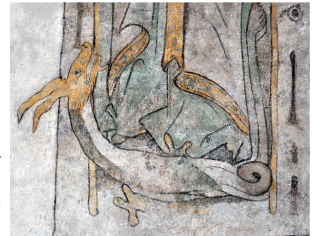
Fig. 25. Drake trampad på av S. Margareta. Kalkmålning, ca 1300, i Sunds kyrka, Åland. Foto Lars Berggren 2010.

Svårigheterna som vi möter i Vä när det gäller den externa utsmyckningen är alltså ganska långt desamma som i många andra medeltida kyrkor. Bevaringstillståndet är dåligt eller uselt; det är inte bara den ursprungliga färgen som försvunnit utan stora delar av själva stenmaterialet har vittrat och fallit bort. Successiva ombyggnationer och utvidgningar har medfört att flera av de reliefpydda blockens ursprungliga placeringar och grupperingar har ändrats, och att det därför är svårt eller omöjligt att bilda sig en uppfattning om den ur-