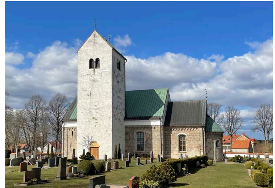
Fig. 2. Mariakyrkan i Vä från sydöst. Church of St Mary, Vä, Scania, from southeast.

Isidorus har på 600-talet ( Etymologiae , bok 12, 4:6–9) inget att tillägga beträffande basiliskens utseende och på 1200-talet förklarar Bartholomeus Anglicus ( De proprietatibus rerum , bok 189) att namnet kommer sig av att den är ormarnas kung (grek. basilevs ). Varken dessa två eller någon av de andra texterna