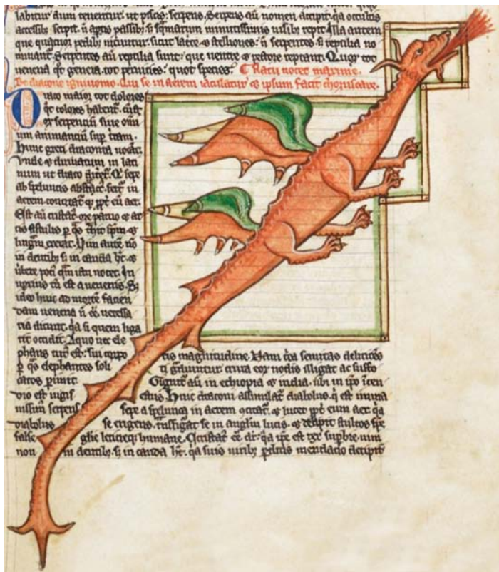
Fig. 6. Eldsprutande drake med två par ben och vingar, 1236–ca 1250. British Library, Harley MS 3244, f.59r.

Dragon with two pairs of legs and wings, breathing fire, 1236–c.1250.