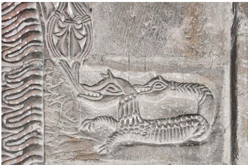
Fig. 12. Amphisbaena i Lunds domkyrka, ca 1100, på det norra tvärskeppskapellets inre fönsteromfattning. Foto Lars Berggren 2014.

Senmurven ( simurgh eller saena ) är också ett fabeldjur med en lång historia. Men den hör inte i första hand hemma i medelhavsområdet utan i Mellanöstern, närmare bestämt i Persien. 14 Enligt legenden är den så gammal att den sett världens undergång tre gånger och därför besitter alla världsåldrars kunskap. Den lever i livets träd (i zoroastrisk och persisk mytologi Gaokerena eller Haoma ) från vilket alla frön och växter kommer och är ett godartat väsen som renar land och vatten och befrämjar hälsa och fertilitet. Precis som fågel Fenix