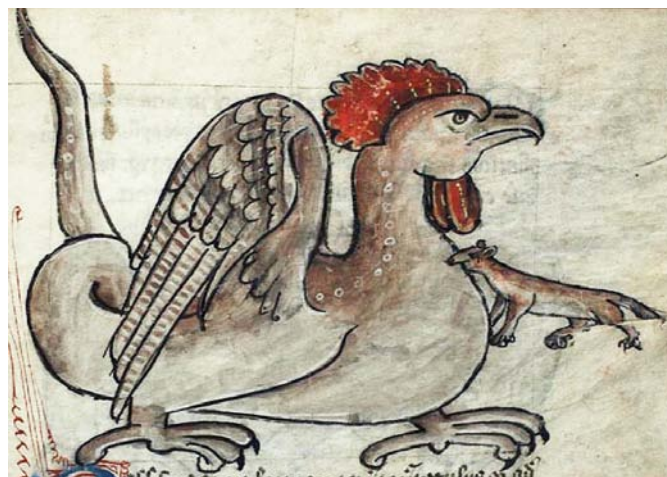
Fig 5. Basilisk med tuppkam och en vessla som biter den i halsen. The Bestiary of Anne Walshe, England, ca 1400. Köpenhamn, Det Kongelige Bibliotek, Gl. kgl. S. 1633 4°, f 51r.

The basilisk, king of the snakes, in an English Bestiary from the 13th century.