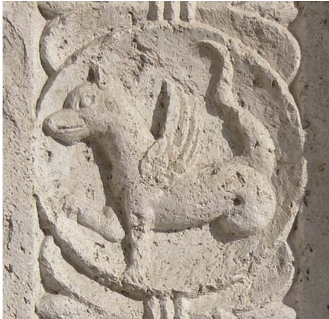
Fig. 17. Senmurv, San Rufino, Assisi, tidigt 1100-tal.

Simurgh on the façade of San Rufino, Assisi, early 12th century.