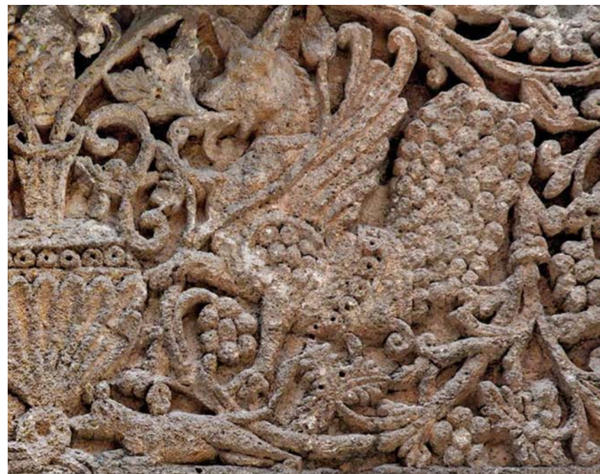
Fig. 13. Senmurv . Relief på fasaden till palatset i Mshatta, Jordanien, 740-tal. Nu i Museum für Islamische Kunst, Berlin.

Lund Cathedral, Scania. Amphisbaena in the eastern chapel of the northern transept, c. 1100.