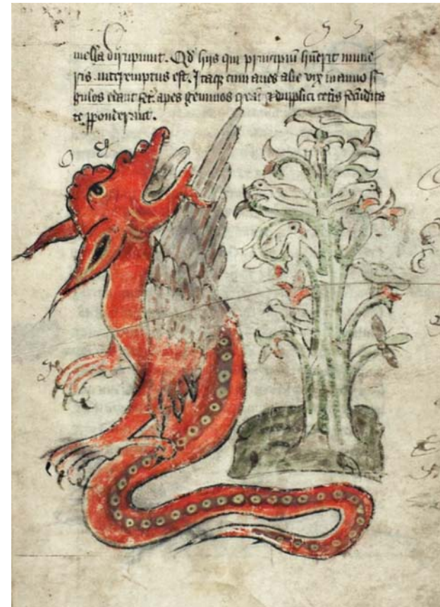
Fig. 9. Drake invid ett peredixion -träd slukande en förirrad duva. Ca 1400. Det Kongelige Bibliotek, Copenhagen, Gl. kgl. S. 1633 4 o , f 49r.

Reliefen i Vä skulle mycket väl kunna vara en drake. För att det åtminstone inte är en basilisk talar avsaknaden av krona eller tuppkam och näbb. I bestiarierna finns det ändå ganska gott om figurer som har stora likheter med vissa basilisker: vingade, tvåbenta, med en slingrande ormstjärt och – i sällsynta fall – med rovdjurshuvuden. Något som skulle kunna tala för draken är de talrika hål som borrats i stjärten/svansen och som får den att se ut som en bläckfiskarm med sugkoppar – samma arrangemang finns exempelvis på draken i det köpenhamnska bestiariet (fig. 9), förfärdigat i England ca 1400. 11 Givet att de första stenhuggare som var verksamma i Vä antas komma från England kan, trots tidskillnaden, en gemensam förebild eller tradition inte uteslutas. 12 Samma rader av borrade hål eller målade prickar utmed ryggar finns emellertid på flera