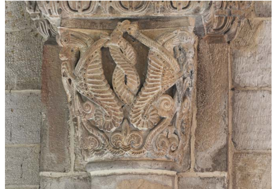
Fig. 11. Amphisbaenor i Lunds domkyrka, ca 1100, på kapitälet till den östligaste av södra sidoskeppets kolonner.

Lund Cathedral, Scania, Sweden. Amphisbaenae on the capital of the easternmost column in the south aisle, c. 1100.