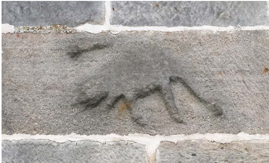
Fig. 24. Mariakyrkan i Vä. Oidentifierat djur på långhusets södra vägg (se fig. 3). Foto Lars Berggren 2020.

Church of St Mary, Vä, Scania. Unidentified animal on the south side of the nave.