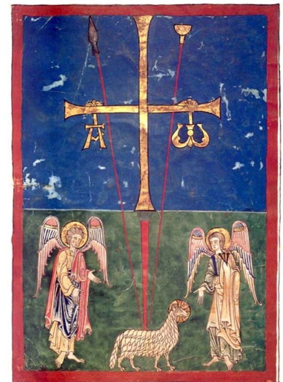
Fig. 21. Frontespisen till Cardeña Beatus-manuskriptet, Spanien, ca 1175–1180. Nu i Metropolitan Museum of Art, New York. MS 232 f. 1v. Efter Wixom & Lawson 2002, 16.

Går man till samtida eller tidigare framställningar av korsfästelsen står det genast klart att man ignorerar isopen och avbildar den med vinäger indränkta svampen som uppträdd på spetsen av en lans. Svampen betraktas som ett av passionsredskapen och delar av den är vördade relikier i ett antal kyrkor i Italien, Frankrike och Tyskland. Att lammet förekommer tillsammans med kors och två lansar, av vilka den ena är svampförsedd, förekommer ytterst sällan. I det äldre materialet har jag bara hittat det i ett par Beatus -illuminationer, men inte i något fall bär lammet på lansarna (fig. 21). 29 Efterhand blir det dock vanligare att kombinera lammet med pinoredskapen och i exempelvis Jan van Eycks be-