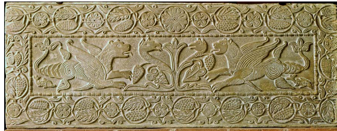
Fig. 16. Senmurver på balustrad (pluteus) från Santa Maria della Pusterla, Pavia, daterad till mitten av 700-talet. Nu i Museo Civico, Pavia.

Simurgh platter. Gilded silver. Samanid dynasty, 9th–10th century.