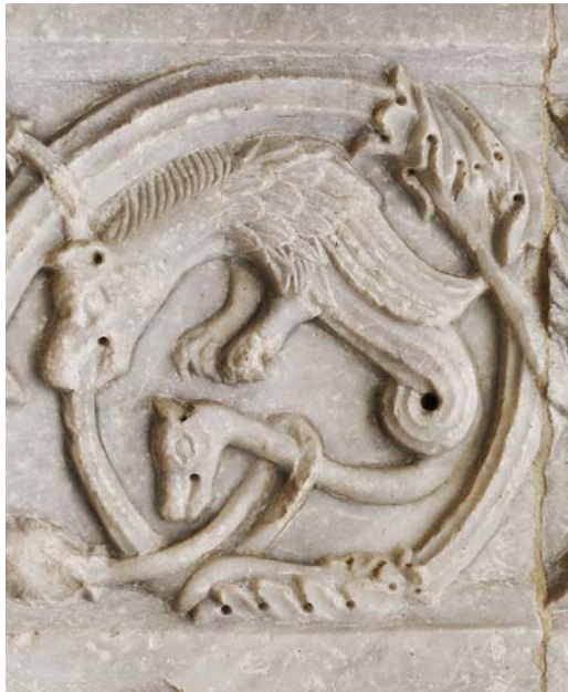
Fig. 10. Amphisbaena på fasaden till San Rufino, Assisi, tidigt 1100-tal. Amphisbaena on the facade of San Rufino, Assisi, early 12th century.

Eller amphivena , amphisbaina , amphisbene , amphisboena , amphisbona , amphista , amfivena , amphivena , av grekiskans amphis (båda hållen, bådadera) och bainein (att gå) är en grekisk mytologisk varelse som nämns av bl.a. Aiskylos, Plinius d.ä. och Isidorus. Plinius konstaterar kort att ”The Amphisbaena has a twin head, that is one at its tail-end as well, as though it were not enough for poison to be poured out of one mouth” ( Naturalis Historiae , bok 8:85), och Isidorus kompletterar med att den har ögon som skiner som lampor och att den är den enda orm som inte skyr kyla ( Etymologiae , bok 12, 4:20). Den har alltså två huvuden, ett på det vanliga stället och ett i andra ändan, vanligen på något slags svans/stjärt. De tidiga källorna omtalar den som en giftig orm som livnär sig på kadaver. Under medeltiden förses den med ett par ben, ibland med två, som är försedda med tassar eller fågelklor. Ibland har den vingar, ibland inte. Huvudena är likadana eller olika och kan likna ormars, drakars eller olika