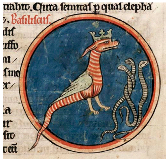
Fig. 4. Basiliken, ormarnas konung. Bestiarium, England, 1200-tal. British Library, Harley MS 4751, f. 59r.

The basilisk, king of the snakes, in an English Bestiary from the 13th century.