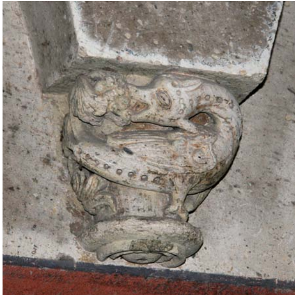
Fig. 14. Senmurv på kapitel i förgården till Maria Laach, Rheinland-Pfalz, ca 1220. Går i litteraturen ofta under beteckningen "lindorm".

Simurgh on a capital in the forecourt of the Maria Laach Abbey Church, Rheinland-Pfalz, c. 1220.